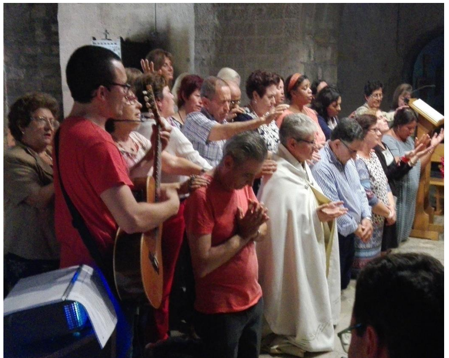
Entrar a la Comunitat? Com deia Pierre Goursat: “És molt senzill! Avancem!”

Un entra a la comunitat perquè li és un estímul per a la vida cristiana. «Després d'una nova trobada amb Crist, el redescobriments de l'amor del Pare i l'experi-